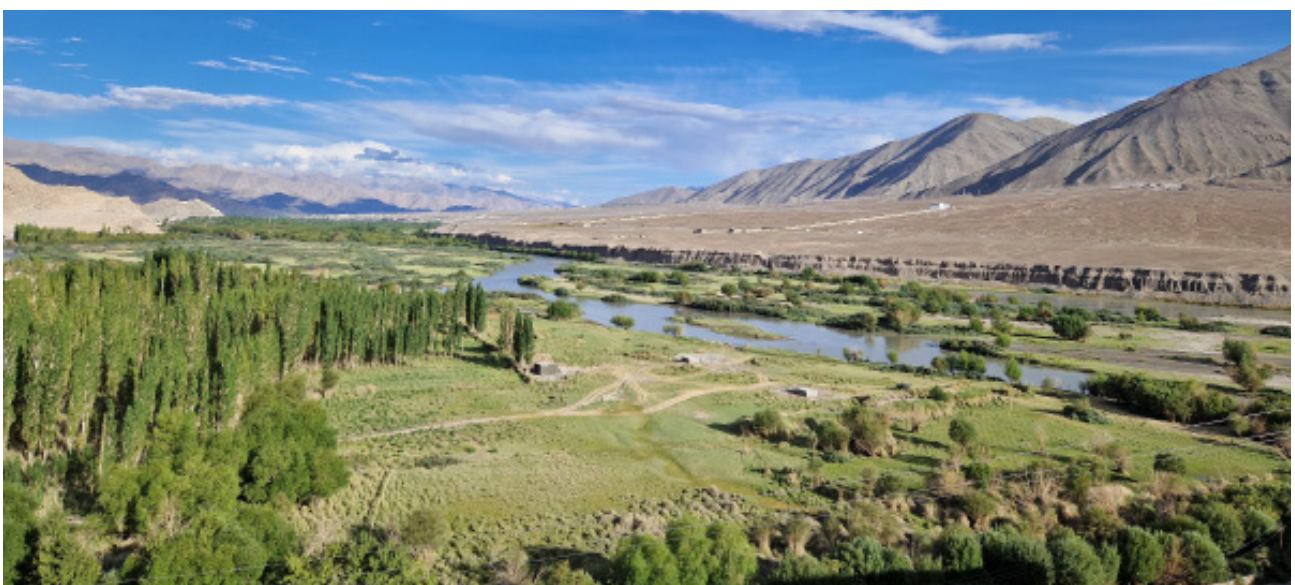
Unterwegs im Indus-Tal