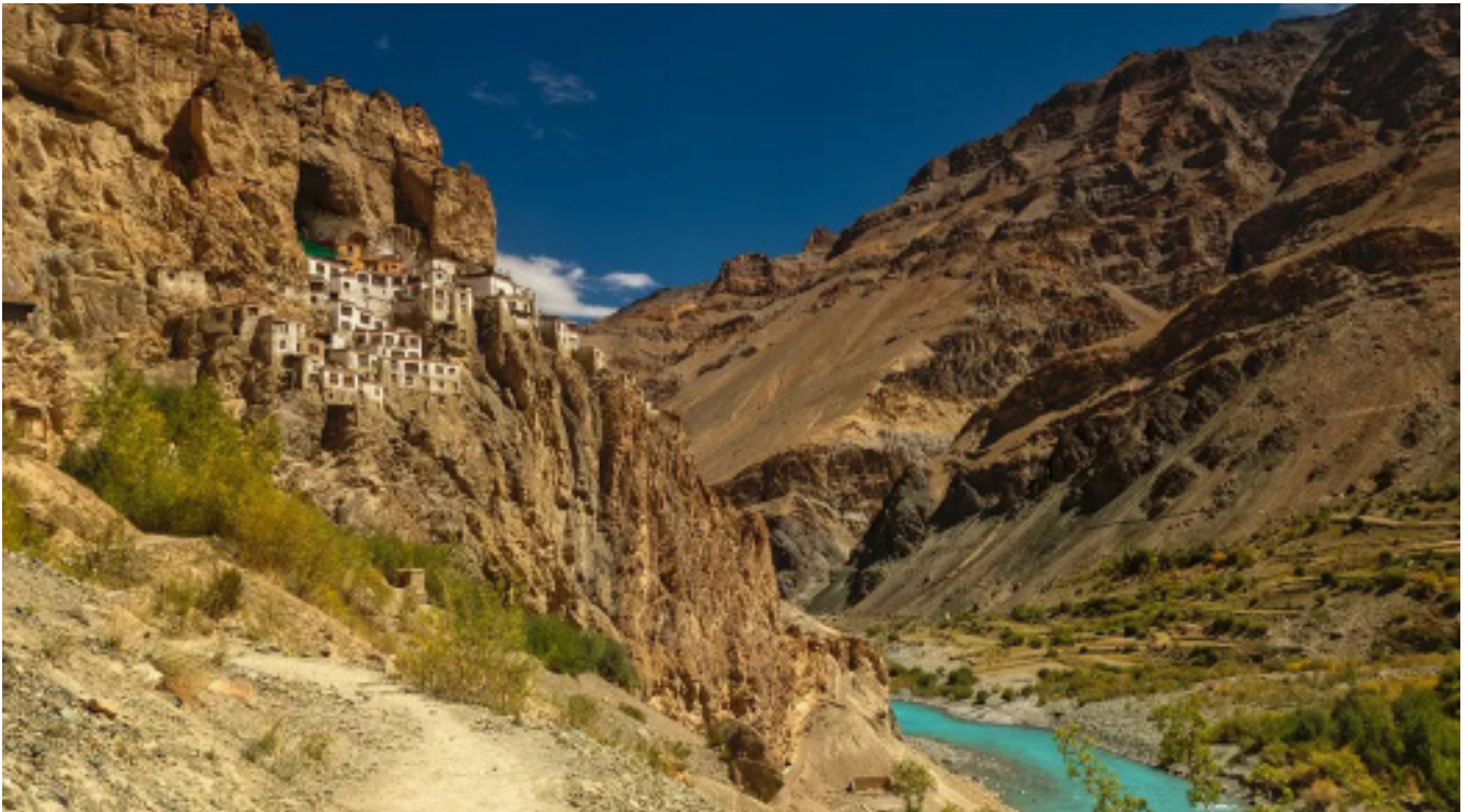
Felsenkloster Phuktal, Zanskar