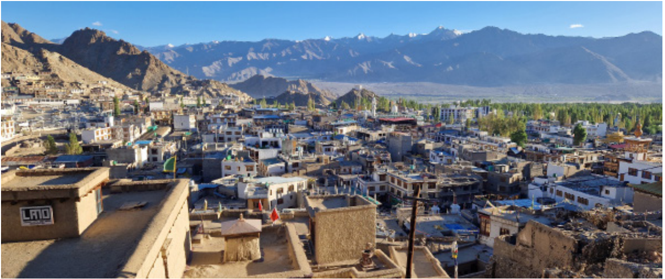
Ausblick vom Palast auf die Altstadt von Leh