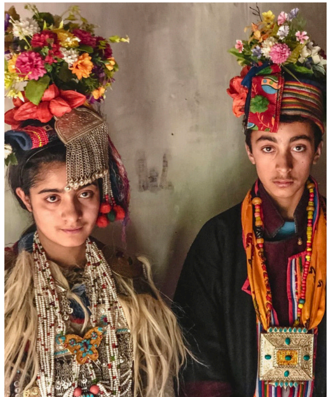
Traditioneller Schmuck im Aryan-Tal