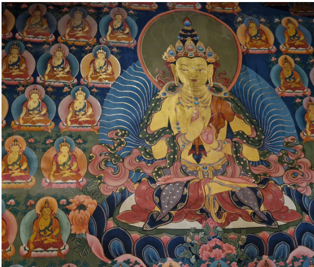
Wandmalereien im Kloster von Alchi