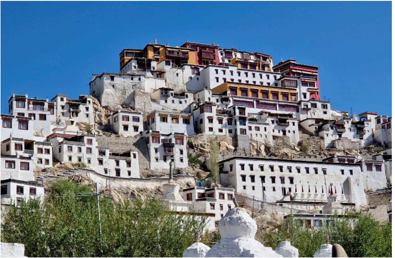
Das eindruckliche Thiksey-Kloster